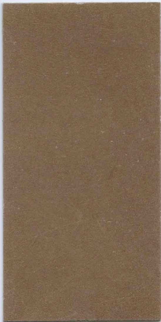
PATINA Bronzo ( Bronze ) / MARMORINO CLASSICO T491