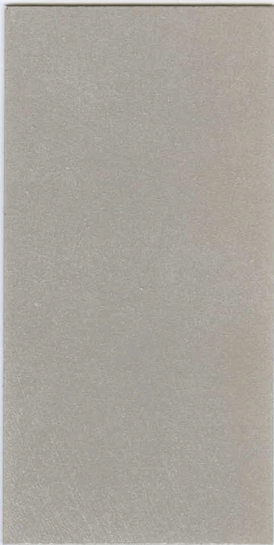
PATINA Argento ( Silver ) / MARMORINO CLASSICO T491