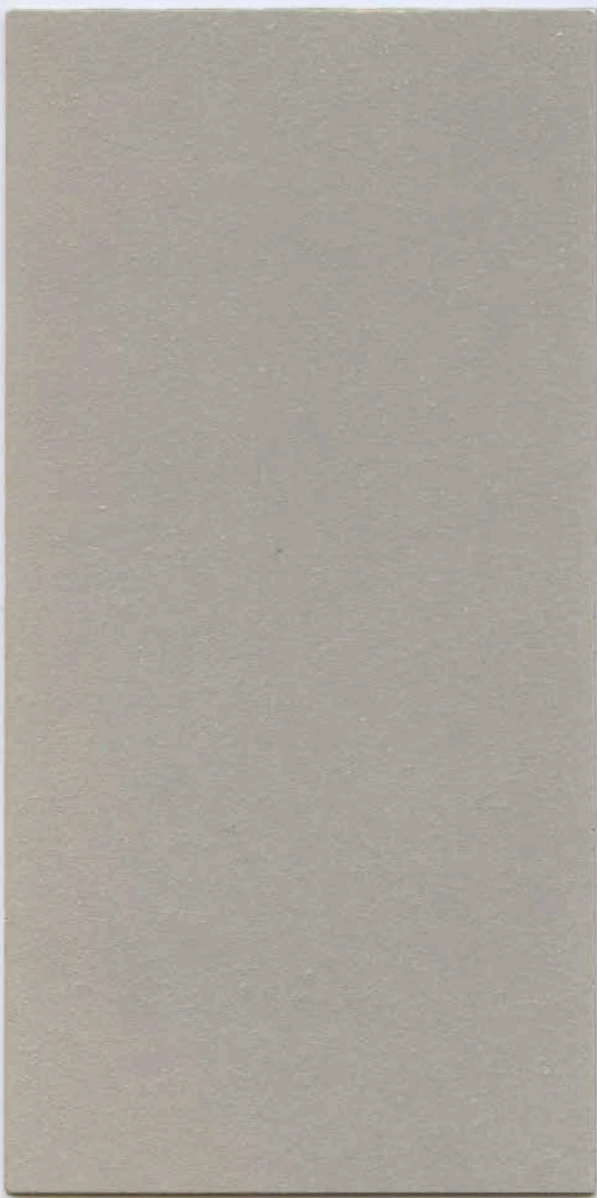
PATINA Oro ( Gold ) / MARMORINO CLASSICO T491