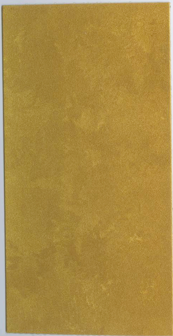
CADORO Oro Zecchino