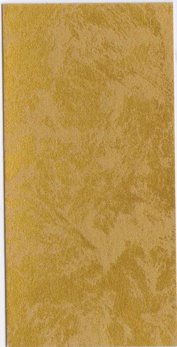
MARCOPOLO LUXURY Oro Zecchino