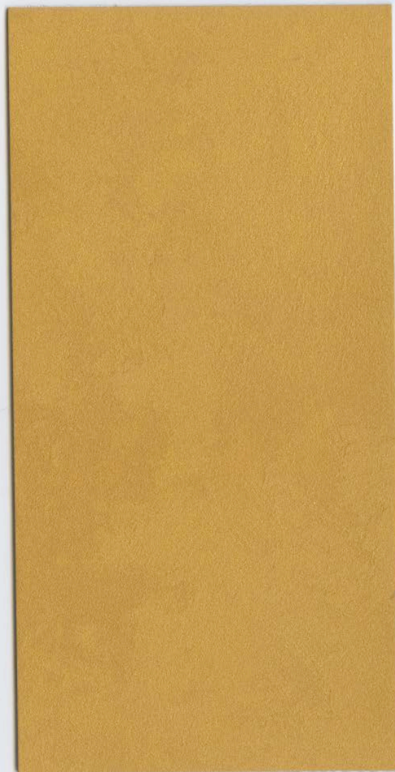
CADORO VELVET Oro Zecchino