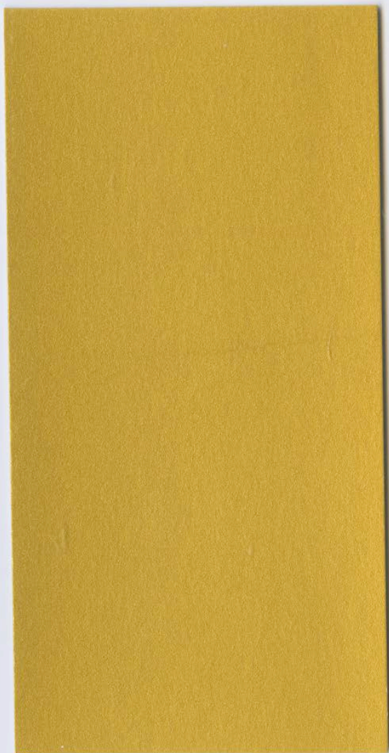
UNIMARC HOBBY Oro